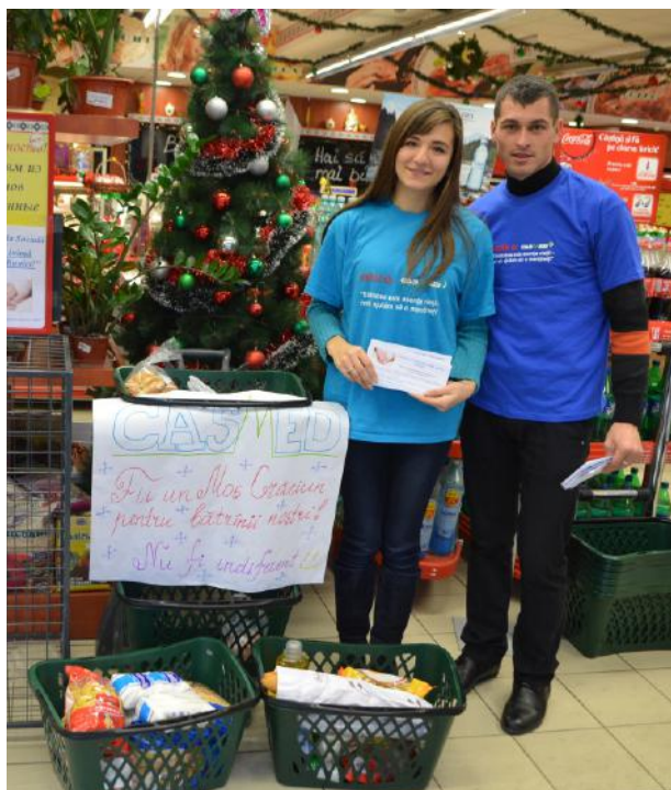
Voluntarii au dedicat alte două zile pentru a contabiliza produsele și a le împărți în colete, care

Inițiativa lor s-a încadrat în contextul campaniei sociale „Din suflet pentru bunici”, pe care AO „CASMED” o organizează al treilea an la rând. Având ca scop colectarea de produse menite să ajungă pe masa de sărbătoare a bătrânilor singuratici, evenimentul a venit totodată să atragă atenția comunității la nevoia de ajutor, de grijă și de o vorbă caldă, de care cei mai mulți vârstnici duc lipsă. Receptivitatea cumpărătorilor nu s-a lăsat așteptată, aceștia oferind fiecare ce a putut. Astfel, au fost colectate paste făinoase, ulei, hrișcă, orez, zahăr, conserve, dulciuri, legume și produse de igienă.